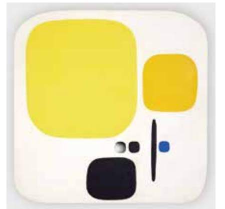
《穴のあるコンポジション》1950年 カーサベルラルテ=パオロ・ミノーリ財団 © Bruno Munari. All rights reserved to Maurizio Corraini srl. Courtesy by Alberto Munari