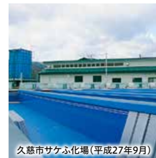
久慈市サケふ化場(平成27年9月)