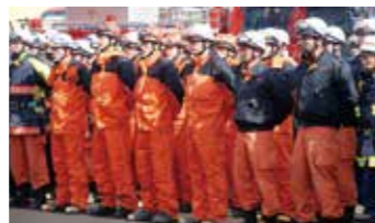
緊急消防援助隊 大船渡市

また、地元消防団員も、自ら被災した団員も多い中、被災住民の救助や避難所の運営支援、行方不明者の捜索活動などを行ったほか、近隣市町村の消防団員延べ1,400名以上による支援活動が行われました。