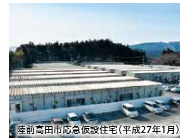
陸前高田市応急仮設住宅(平成27年1月)