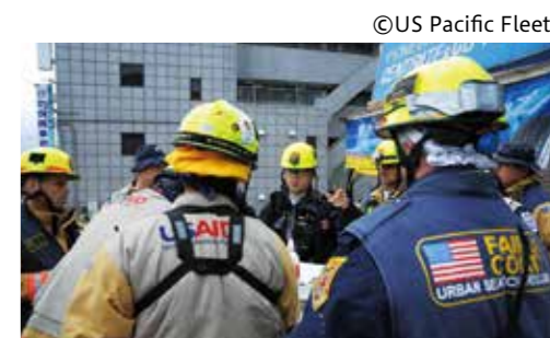
海外からの救援隊 大船渡市(平成23年3月)

また、発災直後から、多くの国々から支援物資が届けられたほか、世界各国からの義援金や寄附金が、三陸鉄道の復旧や被災地における保育所・学童施設・ホールなどの施設整備に役立てられました。