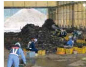
釜石市災害廃棄物の選別作業 (平成25年10月)