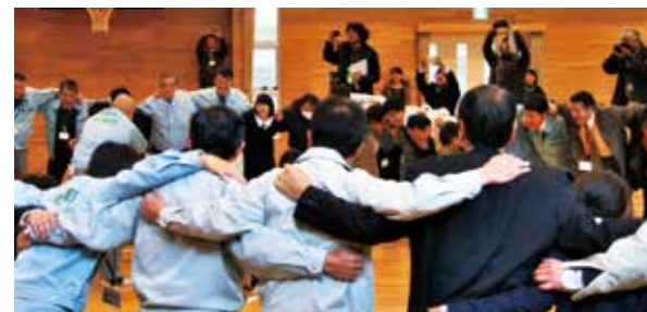
大槌中学校生徒会による派遣職員に感謝する会(平成25年12月)

今回の震災により、沿岸の5市町村で108人の職員の方が犠牲となりました。このような中、発災直後の3月末に、名古屋市から陸前高田市に対して職員派遣の申出があり、その後も県内及び全国の自治体から同様の申出を受け、平成23年度は171人を、平成29年3月までに3,100人を超える派遣をいただき、現在も全国の自治体に協力を依頼しています。