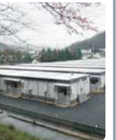
釜石市応急仮設住宅