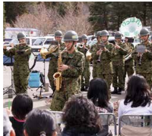
音楽隊によるミニコンサート 田野畑村

自衛隊は、被災者の救出や行方不明者の捜索のほか、がれきの撤去、支援物資の運送、給水、給食のほか、女性自衛官による「お話し隊」が避難所を巡回して傾聴活動を行うなど、多方面にわたる活動を展開しました。