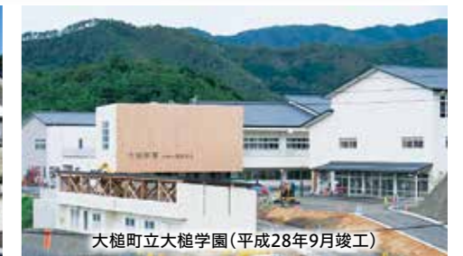
大槌町立大槌学園(平成28年9月竣工)