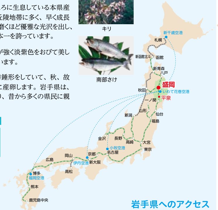
岩手県へのアクセス