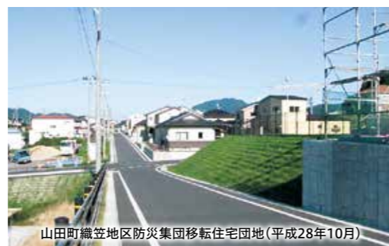
山田町織笠地区防災集団移転住宅団地(平成28年10月)