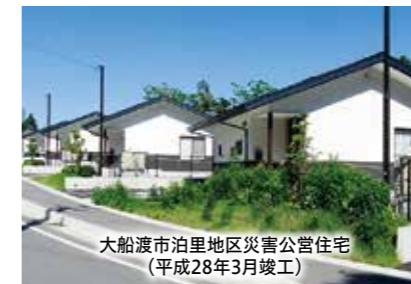
大船渡市泊里地区災害公営住宅(平成28年3月竣工)