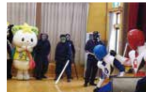
警察官によるヒーロー寸劇