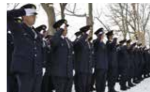
特別出向警察官着任式

また、大船渡・釜石・宮古署では、沿岸地域の児童・幼児を対象に、ヒーロー寸劇等による防犯啓発活動も行いました。