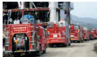
県外から被災地に到着した消防車群 陸前高田市