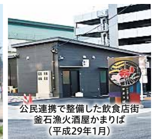
公民連携で整備した飲食店街 釜石漁火酒屋かまらば(平成29年1月)