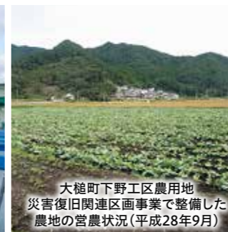
大槌町下野工区農用地 災害復旧関連区画事業で整備した農地の営農状況(平成28年9月)