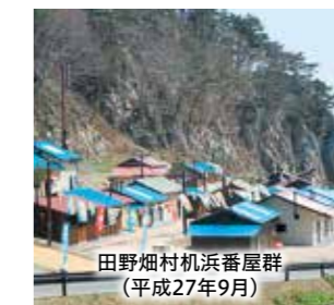
田野畑村机浜番屋群(平成27年9月)