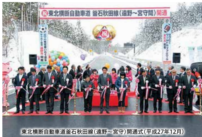
東北横断自動車道釜石秋田線(遠野～宮守)開通式(平成27年12月)