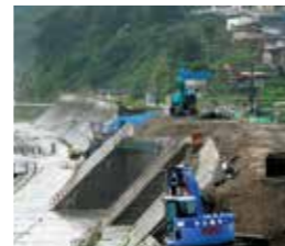
久慈市久喜漁港海岸災害復旧工事(平成25年9月)