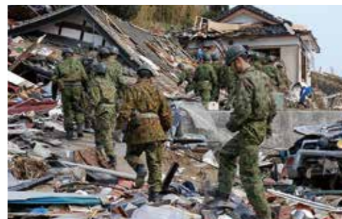
行方不明者の捜索 大船渡市

東日本大震災津波では、10万7千人という空前の規模で自衛隊が派遣されました。陸・海・空の3自衛隊が、訓練以外で統合任務隊として運用されたのは初めての事です。