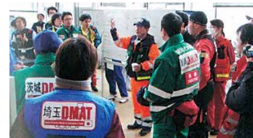
参集したDMATによる打合せ 宮古市(平成23年3月)

さらに、岩手県医師会(JMAT岩手)による、内陸部から沿岸被災地への診療応援活動により、2つの県立病院がその支援を受けました。