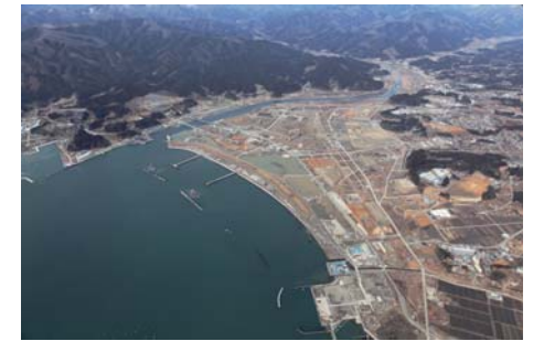
上空から見た公園予定地（平成 27 年 3 月）

陸前高田市高田松原地区に整備される『高田松原津波復興祈念公園』は、「東日本大震災津波の被災の実情と教訓の伝承」、「復興への力強い意志と力の発信」、「三陸地域に育まれた津波防災文化の継承」等を基本方針とし、復興の象徴として整備を進めています。震災津波伝承施設は、この基本方針に基づき、同公園内において具体的に東日本大震災津波の実情と教訓を伝承するための施設として整備するものであり、本計画は、震災津波伝承施設の整備をすすめる上で踏まえるべき、展示の基本的な考え方や方向性をまとめたものです。