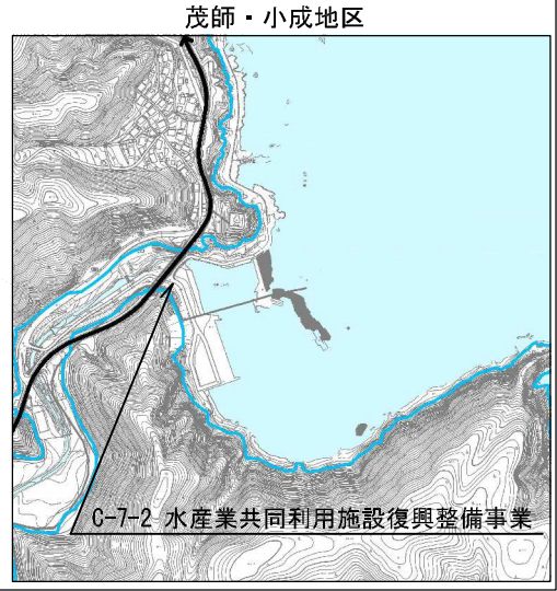
C-7-2 水産業共同利用施設復興整備事業