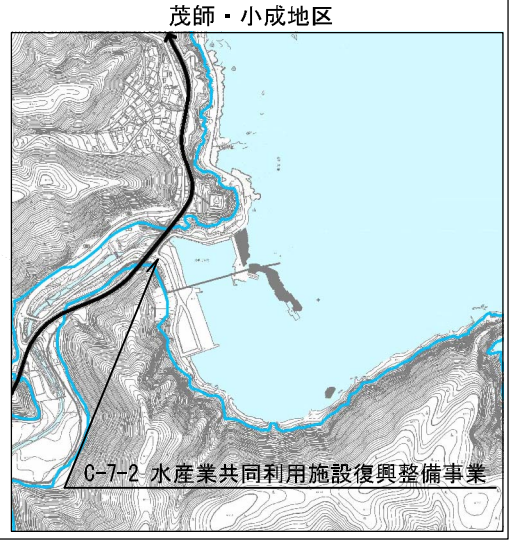
C-7-2 水産業共同利用施設復興整備事業