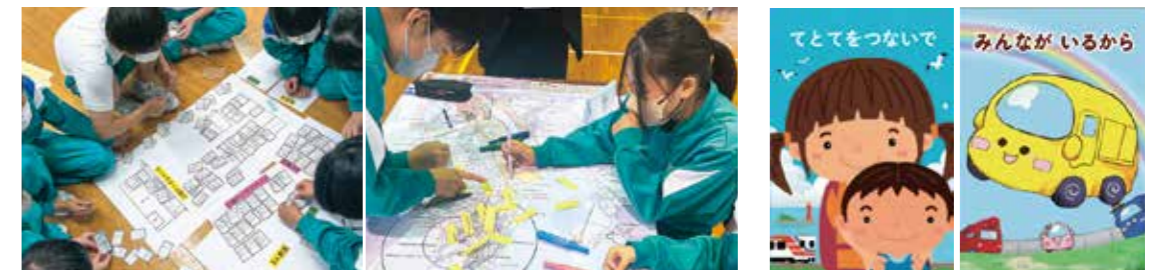
学校防災アドバイザー派遣事業の活用