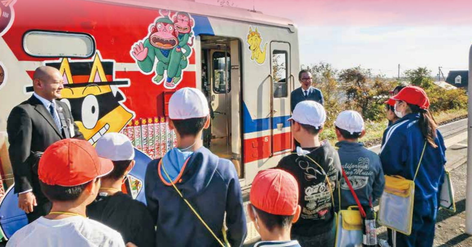
震災学習列車で学習する子どもたち

皆さまから寄せられた御支援は、子どもたちの「暮らし」と「学び」に役立てられています。