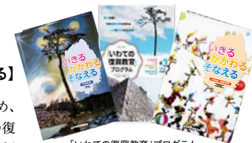
「いわての復興教育」プログラム

岩手県では、郷土を愛し、その復興・発展を支える人材を育成するため、県内全ての公立小・中学校及び県立高等学校・特別支援学校で、「いわての復興教育」プログラムに基づきながら、震災津波の教訓から得た3つの教育的価値を育てています。