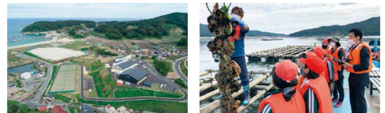
ひろたハマラインパーク全景

東日本大震災津波で被災し、移転・新築により令和3年7月に再オープンした県立野外活動センター(愛称：ひろたハマラインパーク)は、各種野外活動やスポーツ合宿等ができる研修施設です。また、「いわての復興教育」として、避難所運営ゲーム、東日本大震災津波伝承館や震災遺構における震災の事実と教訓の伝承、三陸鉄道学習列車、漁業体験など、周辺地域の施設や団体等と連携した研修を行うこともできます。