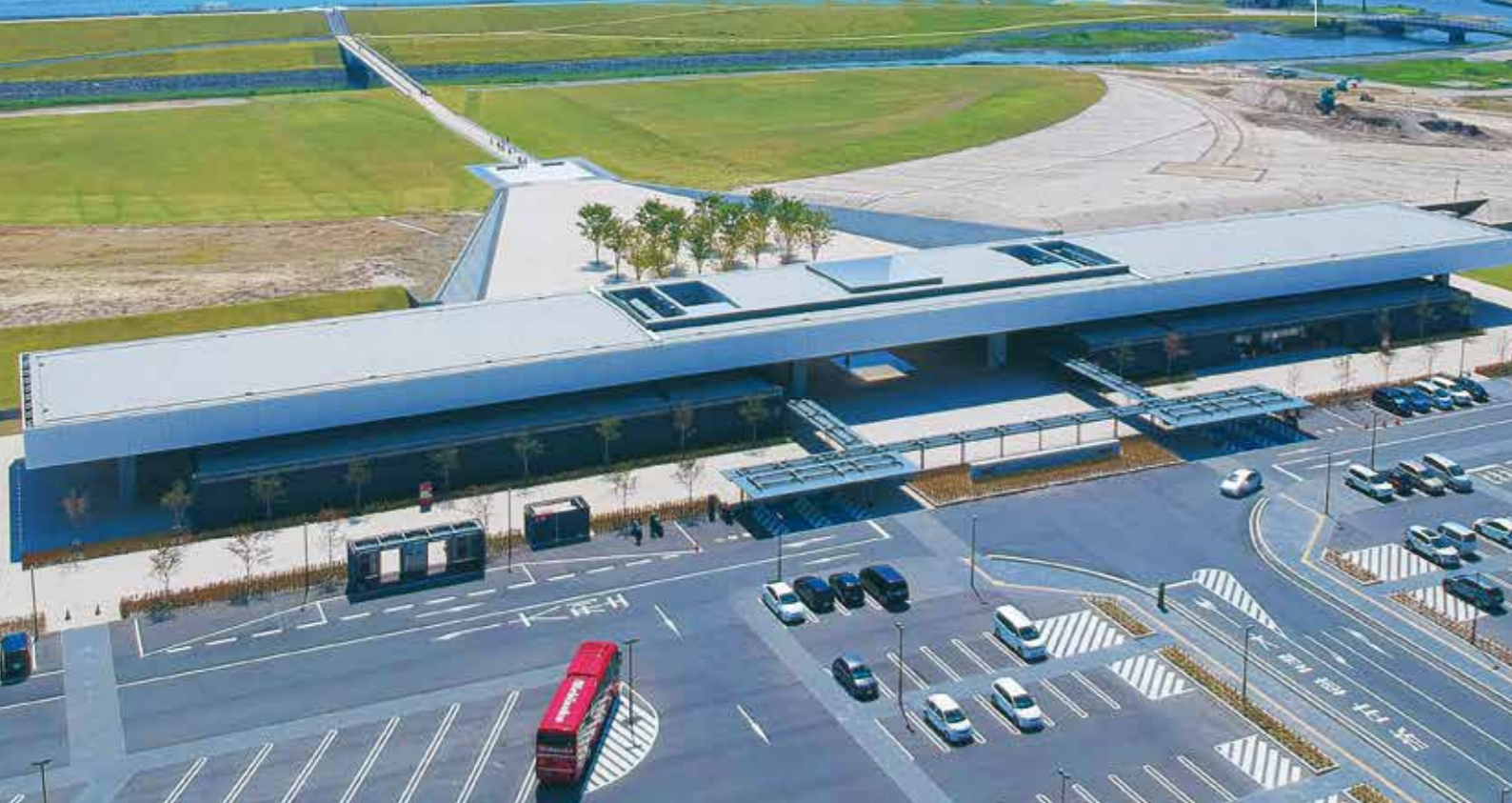
東日本大震災津波伝承館外観