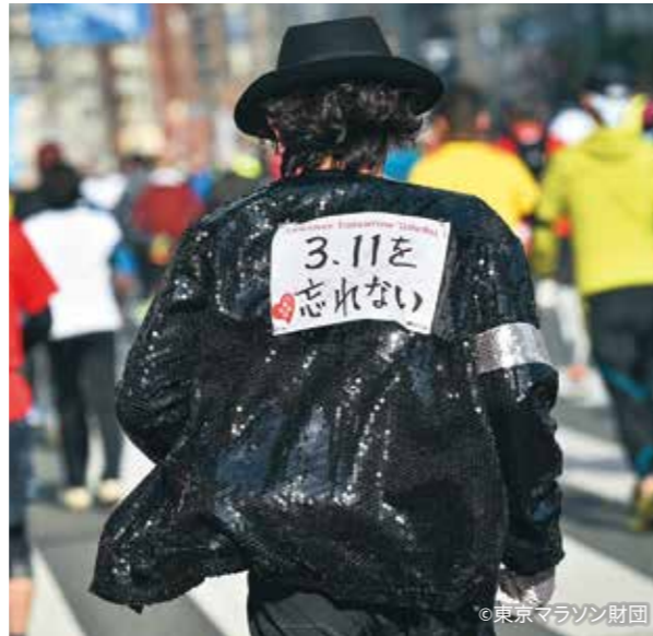
東京マラソン2017の様子

「被災地の育英事業に寄付をすることで、子どもたちの未来への希望と支援の輪を広げたい。子どもたちが笑顔で成長できる社会の実現に向けて、精一杯頑張る姿を表せたらと思います。」(25歳男性) (寄稿日:令和5年10月)