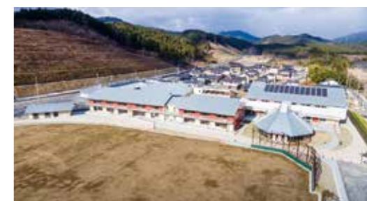
高台に再建された陸前高田市立気仙小学校

岩手県では、東日本大震災津波により69施設(文化会館などの文化施設11件、体育館や野球場等の体育施設58件)が被害を受けました。このうち、復旧することとした67施設は、令和3年7月までに全ての施設が復旧しました。