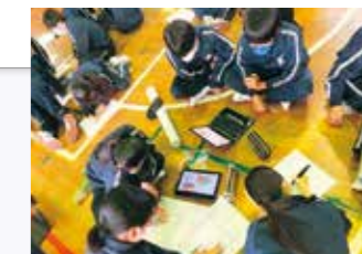
復興教育の学習風景