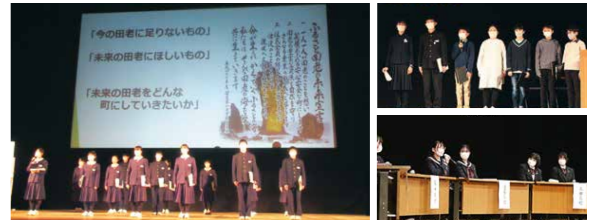
児童生徒実践発表会の様子

「いわての復興教育」の3つの教育的価値をテーマにした「絵本」を制作し、県内の幼稚園や保育所、図書館、公民館等に配架し、読み聞かせなどにより、震災の教訓を次の世代に語り継いでいきます。