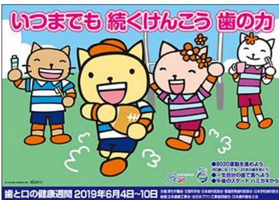
「第14回8020健康フェスタ」ポスター

今年度の標語は「 いつまでも 続くけんこう 歯の力 」となっています。多くの地域、関係者・機関での取組をお願いします。