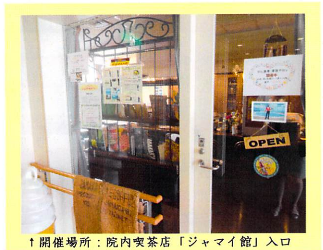
↑開催場所：院内喫茶店「ジャマイ館」入口

第1回目は4月10日に開催され、8名の方の参加がありました。お互いに話したり聴いたり、これまで語られる事のなかった思いを話せる場になった様子でした。「いっぱい話げできた。次回もまた来たい。」と来月の申し込みをされて帰られた方もいらっしゃいました。