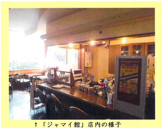
↑「ジャマイ館」店内の様子