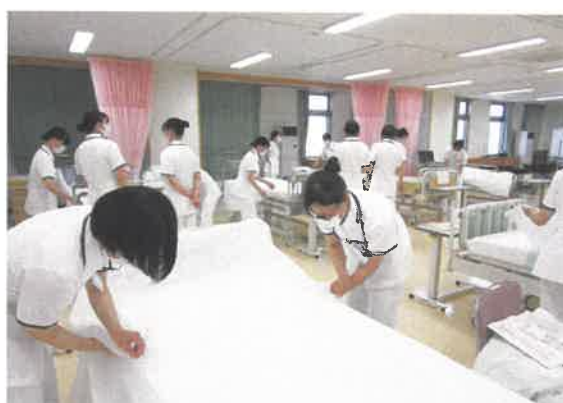
ベッドメイキングの様子