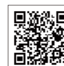
いわて結婚応援パスポートHP

【郵送】 〒020-8570 盛岡市内丸10-1 岩手県保健福祉部子ども子育て支援課 「いわて結婚応援パスポート事業」協賛店募集担当 宛 【いわて結婚応援パスポートHP】 協賛店申込フォームに、必要事項を入力して送信 http://www.pref.iwate.jp/kosodate/shoushika/44510/059526.html