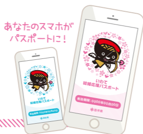
あなたのスマホが パスポートに!