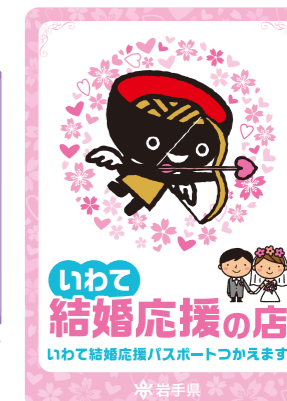
いわて結婚応援の店 ステッカー

申込内容を確認後、県の「いわて結婚応援の店」名簿に登録し、後日、登録証とシンボルマーク入りステッカーを送付します。