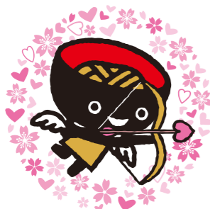
いわて結婚応援パスポート