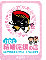
いわて結婚応援の店 ステッカー