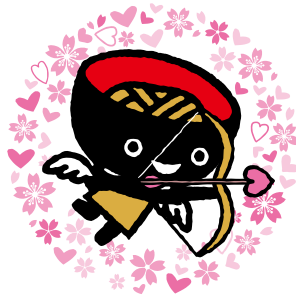
いわて結婚応援パスポート