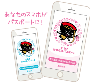
あなたのスマホが パスポートに!