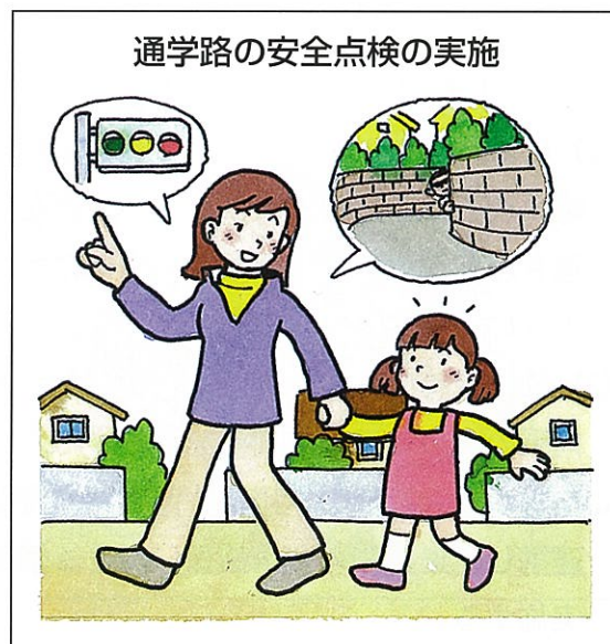
登下校を地域全体で見守る体制の整備