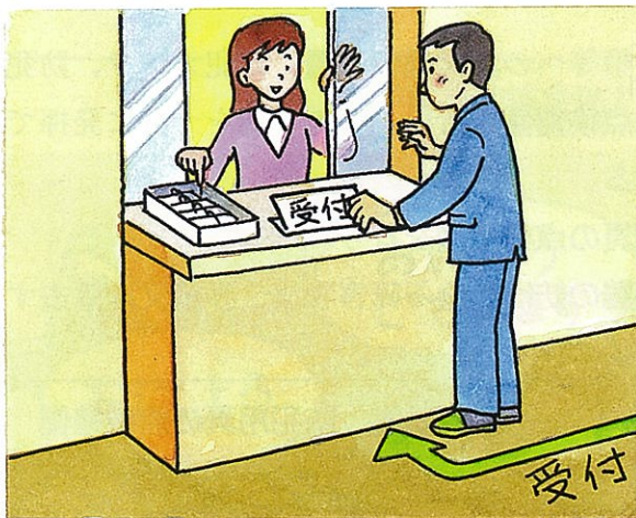
受付の明示と来訪者証の着用依頼