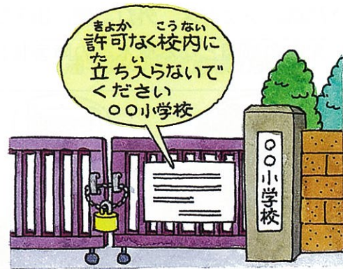
侵入を禁止する旨の看板