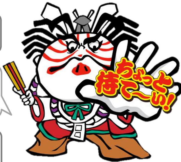
いわて消費者トラブル防止啓発 キャラクター まてのすけ