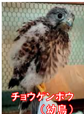
チョウゲンボウ (幼鳥)