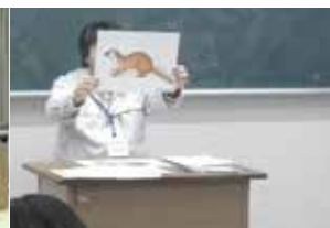
技能試験（鳥獣判別）