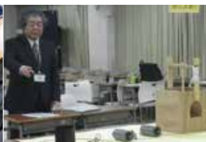
技能試験（わなの判別）