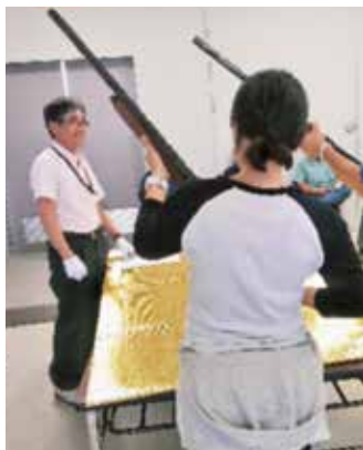
銃の取扱いの講習 (写真の銃は模擬銃です)