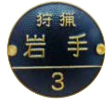
狩猟者記章 (第一種銃猟)