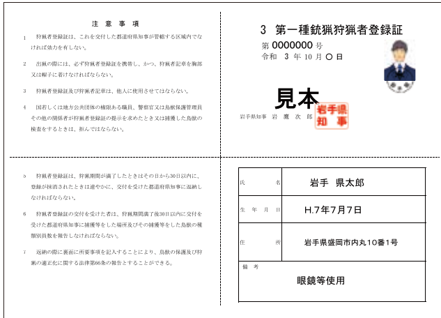
狩猟者登録証 (第一種銃猟)

※ 狩猟者登録証 と 狩猟者記章 は、 狩猟中に携帯・着用しないと法律違反となります。