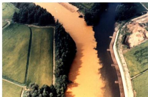
汚染された松川と北上川の合流点(S49年)

旧松尾鉱山の坑廃水は、 硫化鉄鉱と水（雨水や地下水）、空気中の酸素との反応によって発生するpH2程度の強酸性水で、有害物質のヒ素も含まれています。