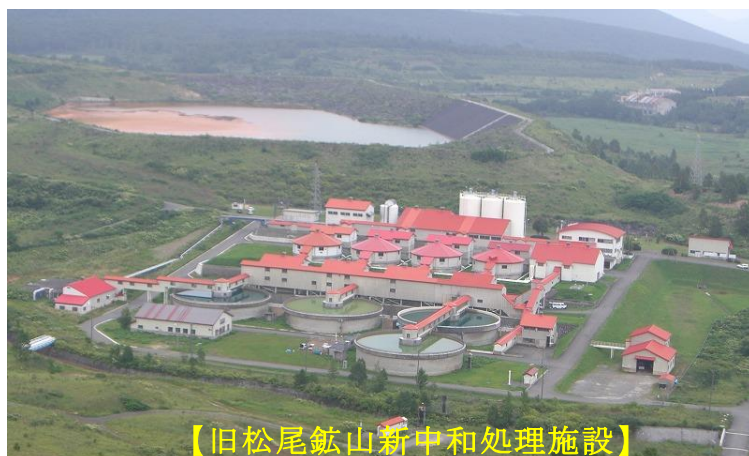
【旧松尾鉱山新中和処理施設】

五省庁会議において、旧松尾鉱山から流出する強酸性水を中和剤（炭酸カルシウム）で中和し、水質を改善するための新たな中和処理施設を旧松尾鉱山跡地に建設することが決定されました。