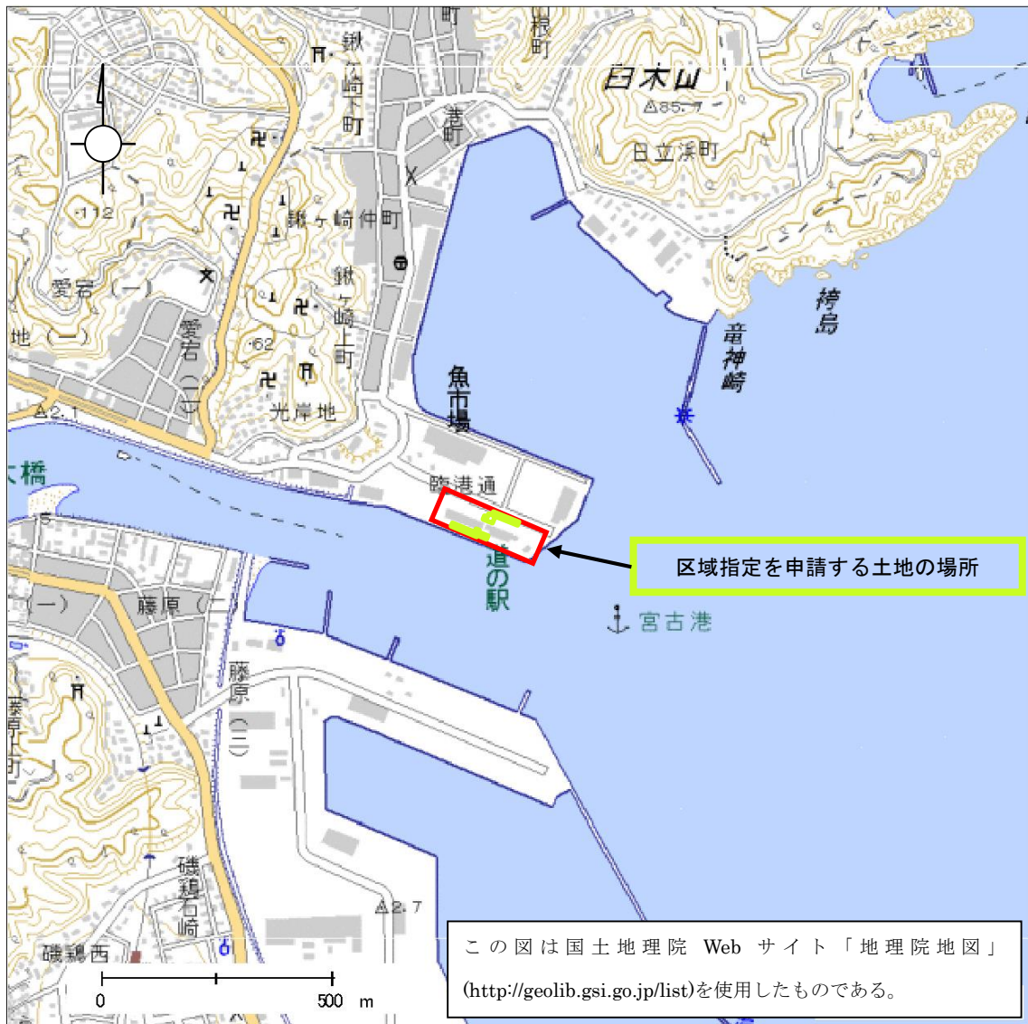
区域指定対象 周辺位置図