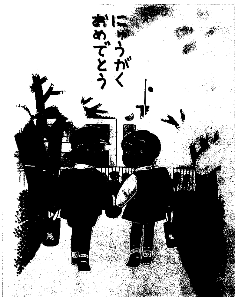
(教科書無償給与袋の原画)

平成二十九年度に検定を行った教科書を全国七会場で展示しています。 新しい教科書を手にとって御覧になりませんか？