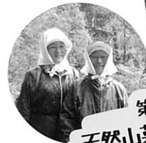
第2回 最優秀賞 天然山菜採り代行サービス