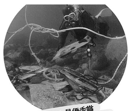
第1回 最優秀賞 三陸の海を取り戻せ!