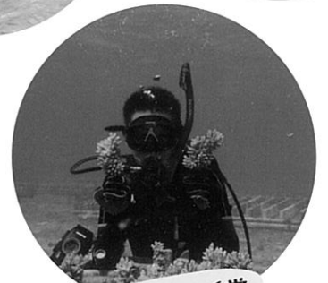
第3回 最優秀賞 サンゴ再生プロジェクト