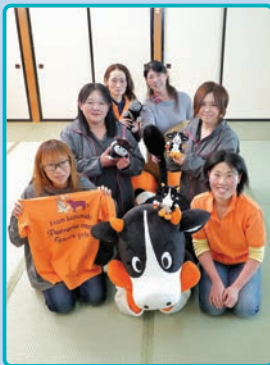
■表紙写真 牛飼い女子グループ「フェラリエワズ」のみなさん

「フェラリエワズ」は、平成28年に葛巻町で牛に携わる女性で立ち上げたグループで、現在は会員27名で活動しています。