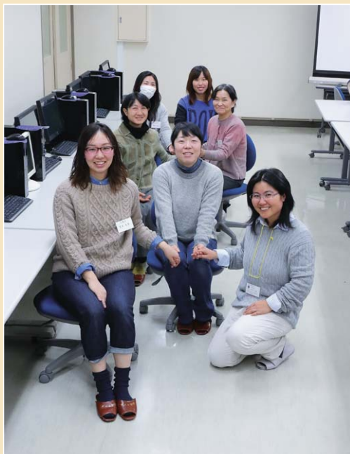
■表紙写真 農業女子セミナーのみなさん 二戸地方では、平成26年度より農業女子セミナーを開催しています。 今年度は、6回シリーズの開催予定で、これまで20名のべ42名の参加者がありました。 農業機械や農業経営視察など研修を既に行っています。今回は、パソコン実習を行い、表計算ソフトを使い、売上伝票のまとめ方を学びました。 普段なかなか使う機会の少ないパソコンですが、将来、経営に役立てたいと、テキパキと操作できるようになりました。 技術や経営を学びながら、将来の夢を語りあえる仲間になってくれればと期待しています。