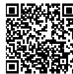
▲省エネ通知のページQRコード