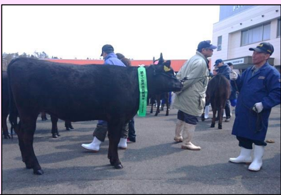
見事、予備選抜通過!