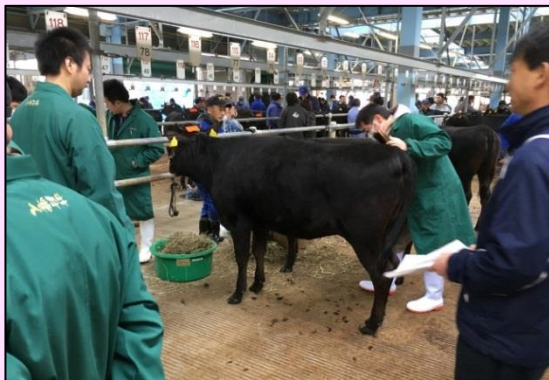
丹念に手入れして審査に臨みます

第3区:過肥が目立ち、角目を損なっている。体上線や腹のゆるさも散見されるので、引き運動などで対応してほしい。体の深さ・伸びが惜しまれる一方で資質・品位に富むものもいた。7月の最終選抜までに種牛性や姿勢にさらに磨きをかけてほしい。