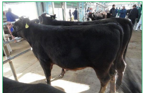
(去勢) 花金幸 × 菊安舞鶴 × 平茂勝 277 日齢 体高 119.7cm 体重 304kg