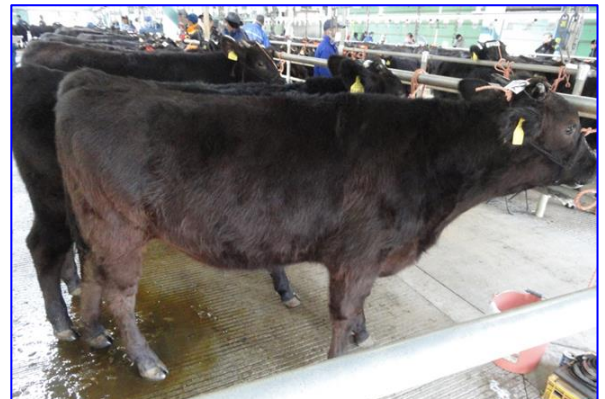
(去勢) 百合茂勝 × 菊安舞鶴 × 平茂勝 257 日齢 体高 121.0cm 体重 293kg