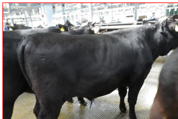
(去勢) 緑乃大地 × 勝忠平 × 平茂勝 246 日齢 体高 118.8cm 体重 325kg