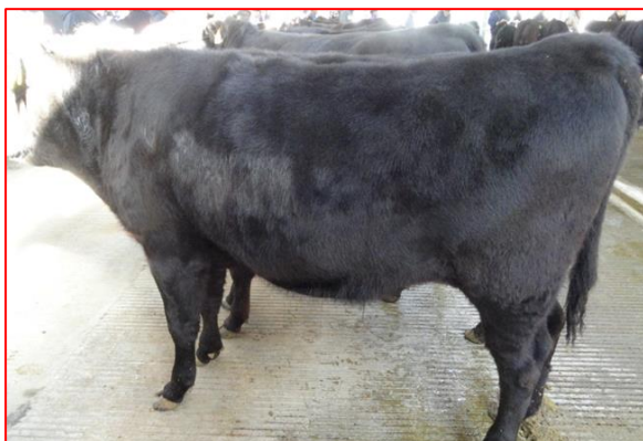
(去勢) 緑乃大地 × 菊福秀 × 勝忠平 296 日齢 体高 119.0cm 体重 296kg