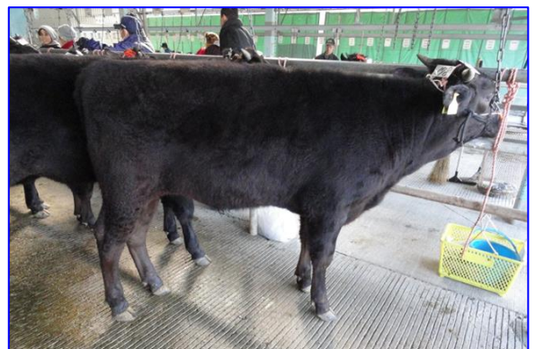
(去勢) 百合茂勝 × 福安照 × 北国7の8 270 日齢 体高 120.2cm 体重 287kg