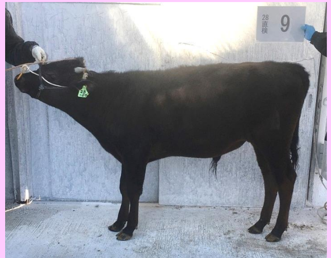
28-09【結乃宝】平成28年6月27日生