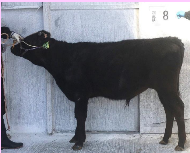
28-08【緑安菊】平成28年8月12日生