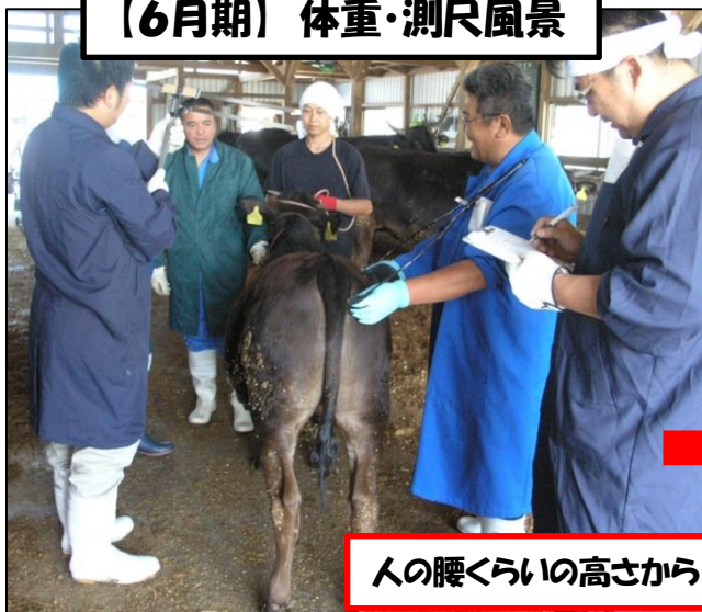
【6月期】 体重・測尺風景