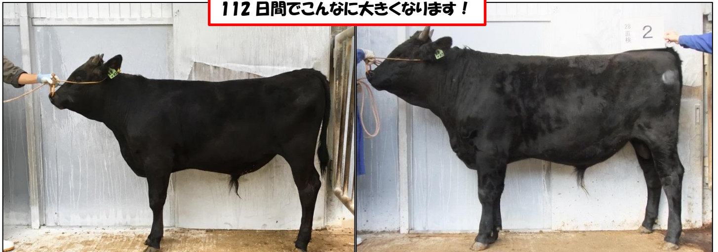
28 直検 2 期 【暁雲】 検定開始時(左、246 日齢)と検定終了時(右、358 日齢)