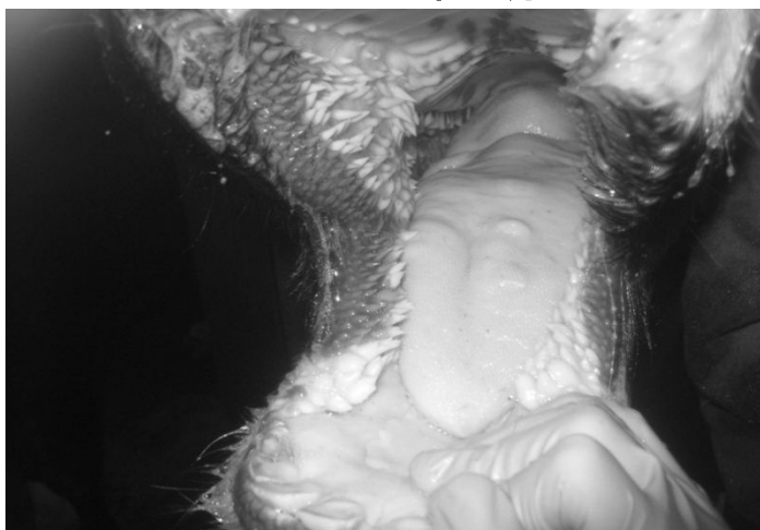
口内の水ぶくれ(初期の症状)