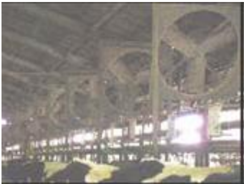
(換気扇による送風)