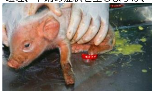
哺乳豚の下痢