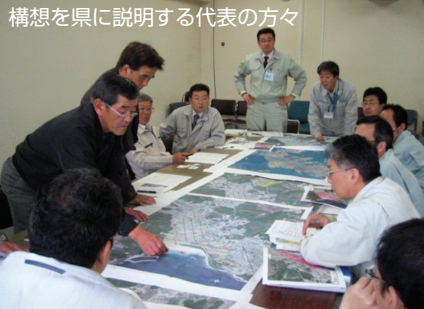
構想を県に説明する代表の方々

そして7月、同地区は住民組織を立ち上げ、独自に住民意向アンケートを実施するなど、地域主体で活動を始めています。