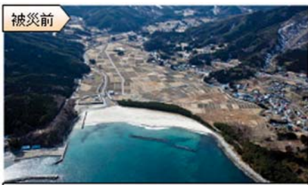
被災前 美しい汀と背後に水田が広がっていた吉浜海岸（大船渡市）

※1「岩手県津波防災技術専門委員会」 県が復興計画を策定するに当たり、専門的な知見に基づいた津波対策施設の整備目標等についての提言を得るため、知事が委嘱した学識経験者からなる委員会。