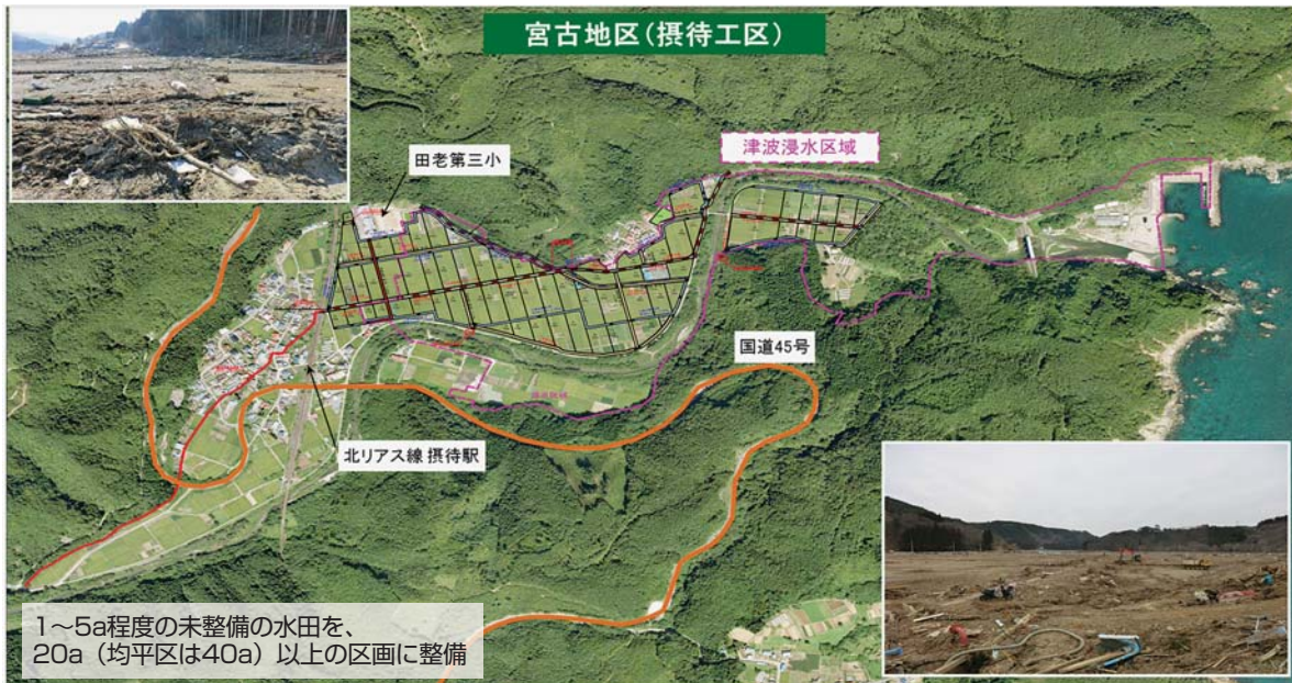
【採択（24年5月末時点）地区一覧】