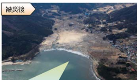
被災後 白砂青松の海水浴場も消失。農地は壊滅状態