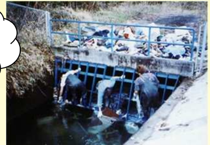
農業用水路でのゴミの除去作業 (都市化・混住化によりゴミの投棄が増加)