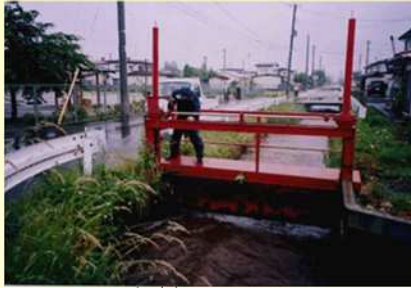
大雨時の水門(ゲート)の開閉操作 (管理人が不足し、維持管理能力が低下)