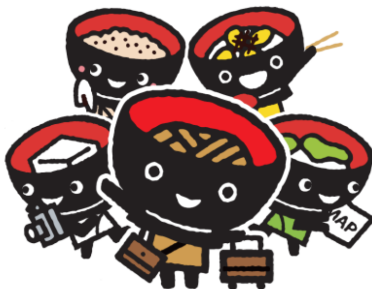
岩手県PRキャラクター「わんこきょうだい」

「観光入込客統計に関する共通基準」 に基づく統計量推計結果 (平成29年1月～3月・暫定値)