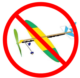
模型航空機の飛行