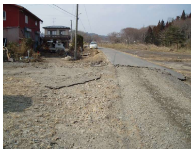
被災後状況 (右岸堤内側)