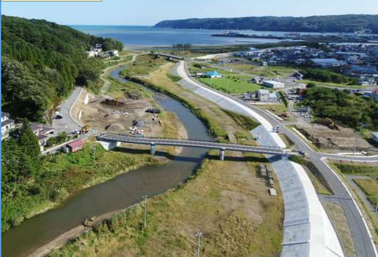
完成年月：令和2年3月