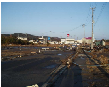
被災後状況 (右岸堤内側)