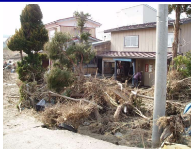
被災後状況 (右岸堤内側)