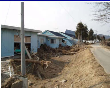
被災後状況 (右岸堤内側)