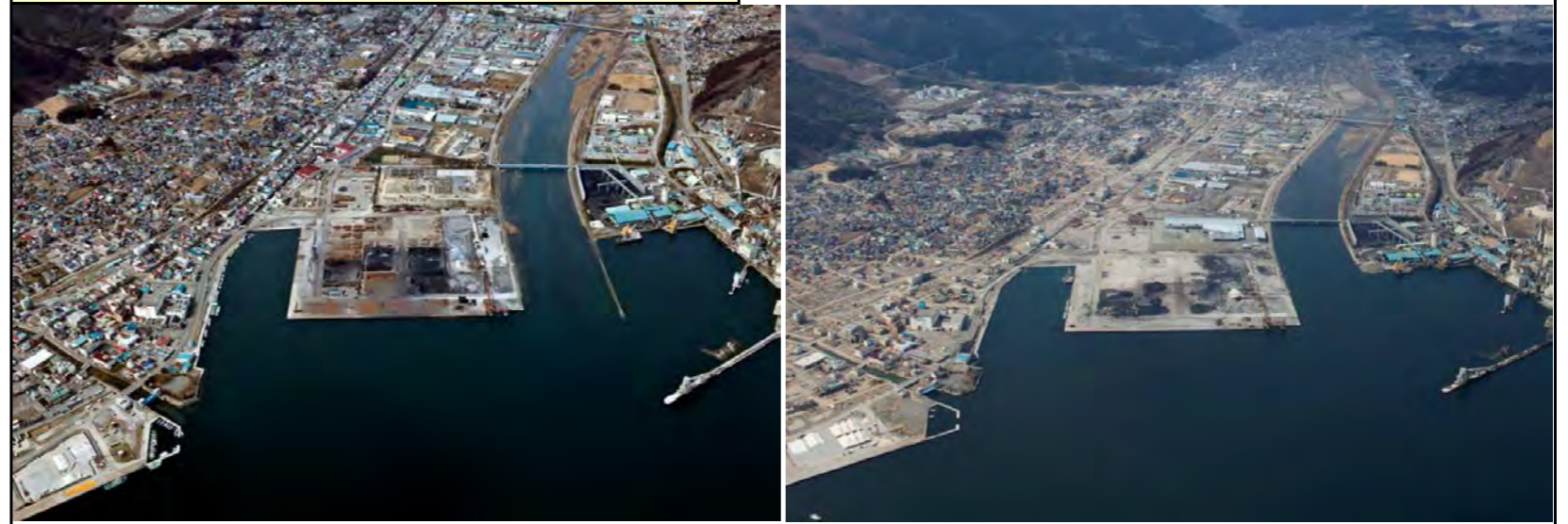
被災前状況 H22.3.14 撮影