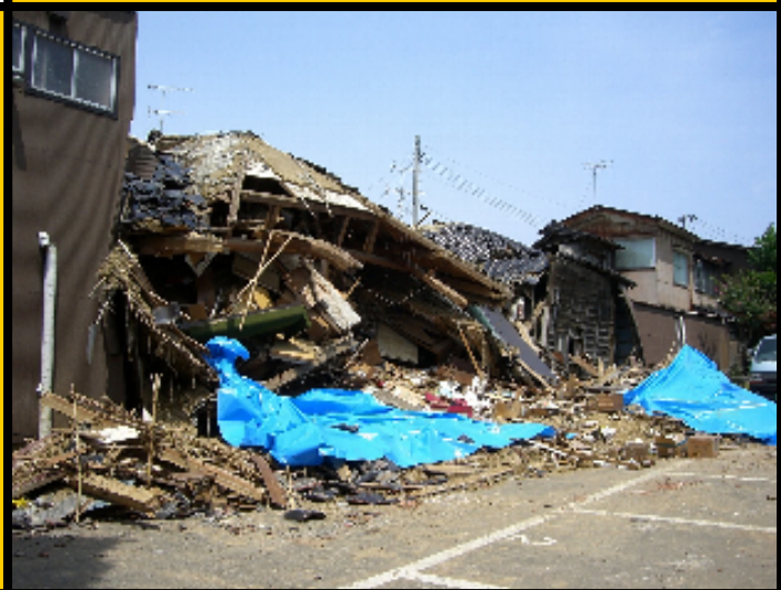
H19.7 新潟県中越沖地震被害住宅