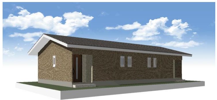
北入りタイプ外観パース (2戸連棟の場合)