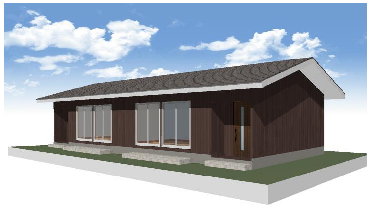
南入りタイプ外観パース (2戸連棟の場合)