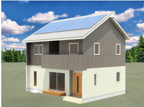
パース 夏至の日の日射遮蔽 太陽光発電設置 OP

※金利は平成 年 月 日現在であり、6年目以降の金利は毎月見直されます。金利が見直されると上記返済額等は異なります。