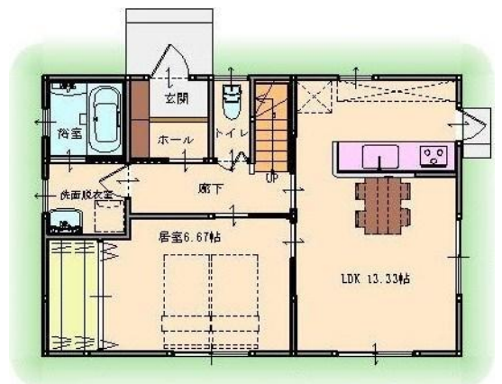
1階北側玄関プラン