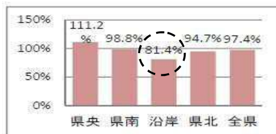
観光客入込数(延べ)H26.4-12月対H22同期比