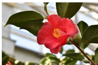
三陸・大船渡第24回つばきまつり イベントスケジュール (●：実施日 ◎：事前予約必要)

世界の椿館・基石では新型コロナウイルス感染症対策を実施したうえで、皆様のご来場をお待ちしております。