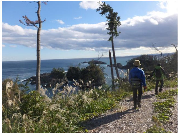
唐桑半島（気仙沼市）