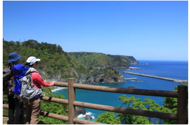
熊の鼻展望台（岩泉町）