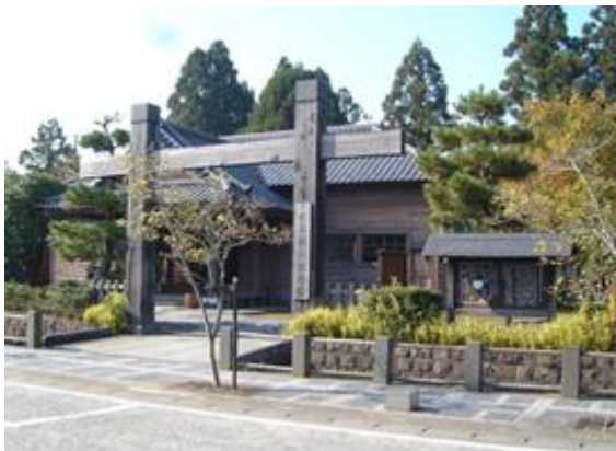
平成 3 年からは、宮城県の誕生経緯や

このような激動の時代の中で、県庁舎として使用されたのは明治 5 年から明治 8 年の 4 年間のみで、その後、現在の宮城県に統合され、明治 9 年からは小学校、さらに明治 22 年からは裁判所として多様に使用されました。