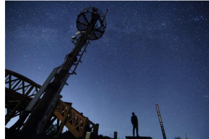
大島亀山の星空観察