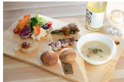
南三陸ワイナリー