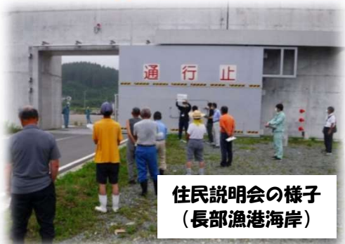
住民説明会の様子 (長部漁港海岸)