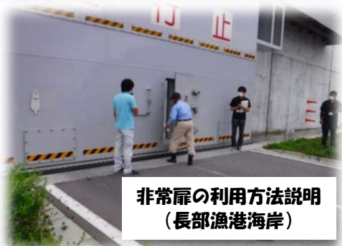
非常扉の利用方法説明 (長部漁港海岸)

県が災害復旧事業等で整備を進めている水門・陸閘自動閉鎖システムについて、大船渡水産振興センターが管理する漁港海岸で順次運用開始しています。