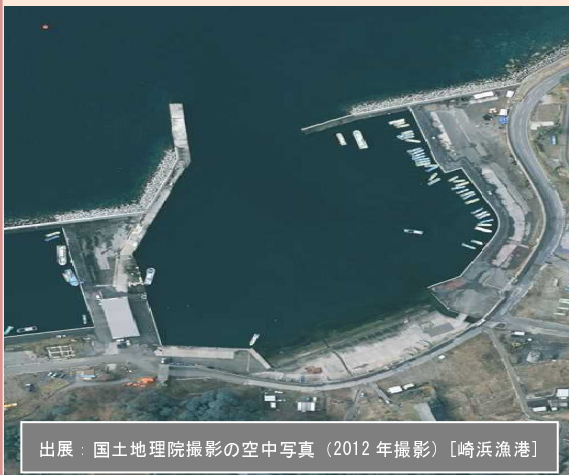
出展：国土地理院撮影の空中写真（2012 年撮影）[崎浜漁港]