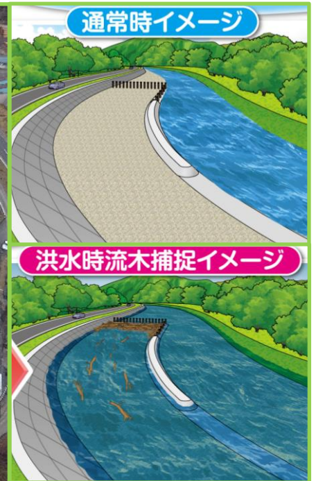
流木捕捉イメージ図