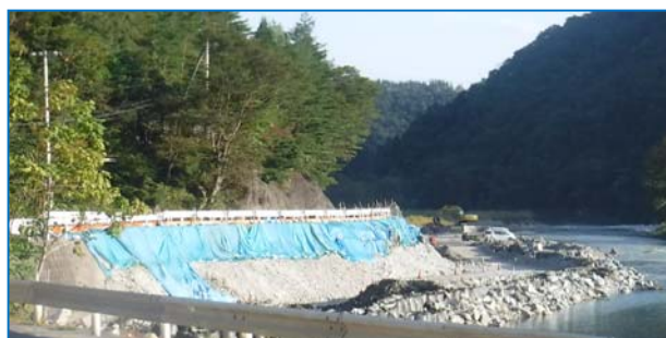
本復旧工事の状況(H29.9)