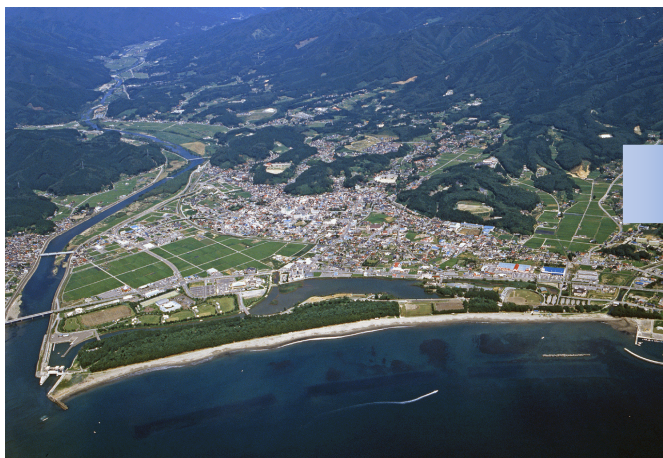
被災前の高田地区海岸