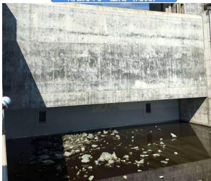
甫嶺水門 全閉（海側）