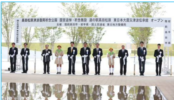
オープン式典 テープカット