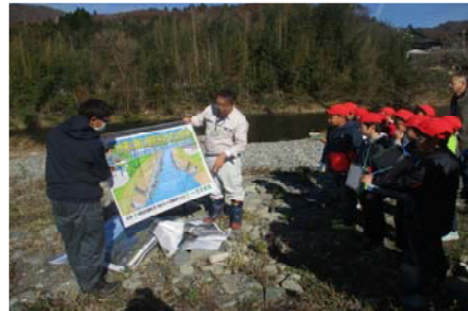
住田整備事務所による気仙川の河川改修工事の説明

次に、世田米川向の河川工事箇所、環境に配慮した河川改修の計画や工事方法について、住田整備事務所職員から説明を行いました。