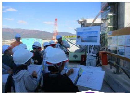
気仙川河口の水門工事2