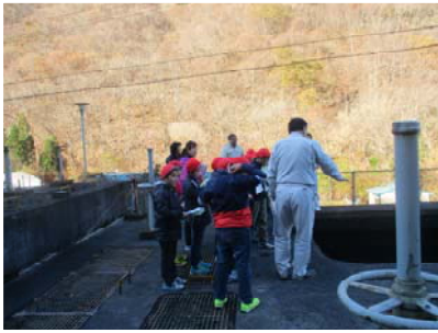
合地沢浄水場見学

当日朝8時の気温は1.6℃とその時期としてはかなり寒かったのですが、生徒のみなさんは元気いっぱい、最初の見学場所である合地沢浄水場に到着しました。水をきれいにするための仕組み等について町役場職員から説明を受け、毎日の暮らしと水のつながりについて理解を深めていました。