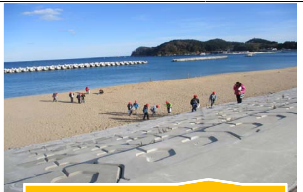
陸前高田市の大野海岸