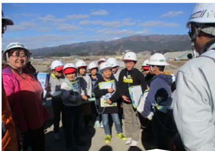
気仙川河口の水門工事1

しみにしていました。最後は、8年ぶりに海開きを行った大野海岸で海と空の青さを満喫していました。これに機会に、川や海、水への関心を深めていただければと思います。