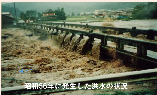
昭和56年に発生した洪水の状況

となっており、川がせき止められ町内に浸水被害を引き起こしてしまう恐れがあることから、川が増水しても安全な構造の橋に架け替えるものであります。